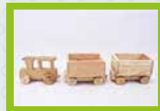
Tren de carga