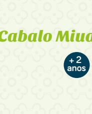
Cabalo Miudiño (II)