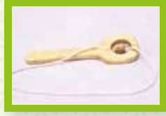
Bolicho de aro