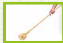
Andacamiños 1 roda