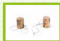
Zancos de tronco