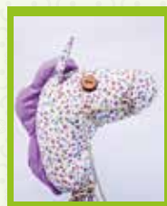
Cabalo Miudiño (I)