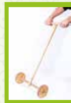
Andacamiños con guiador